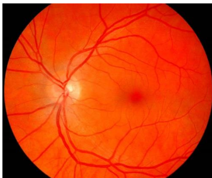
Bildet over: normal øyebunn